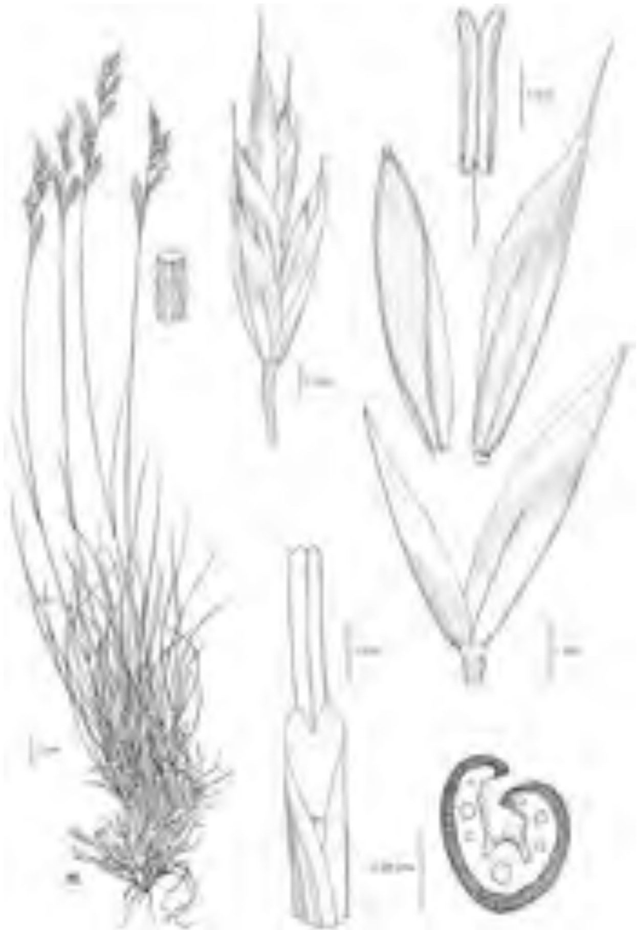
Fig. 29 Minière de Tende, Alpes Maritimes, (Francia), 9/8/1874, E. Burnat (W) ( F. scaberculmis ).