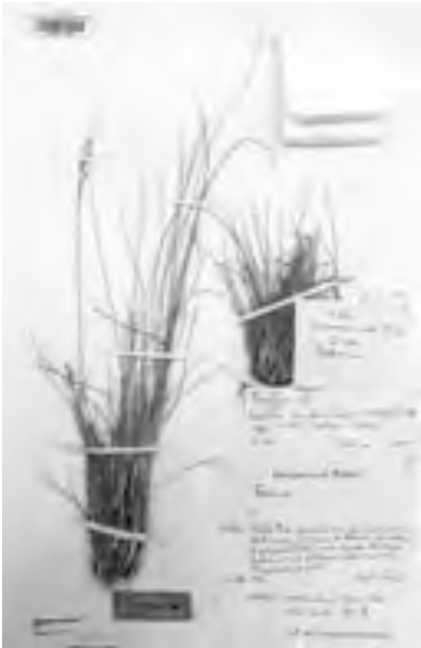
Fig. 16 Holotypus di Festuca lueddii . Holotypus of Festuca lueddii .