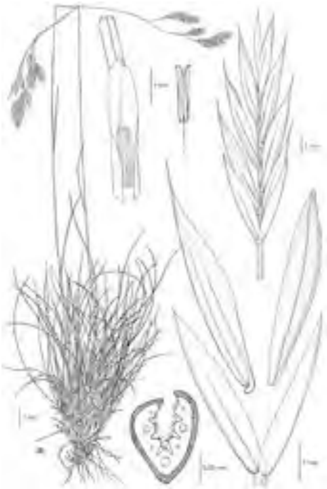
Fig. 2 Le Prese, Bormio (SO), 17/7/1974, C. Steimberg & C. Ricceri (H-FI) ( F. acuminata ).