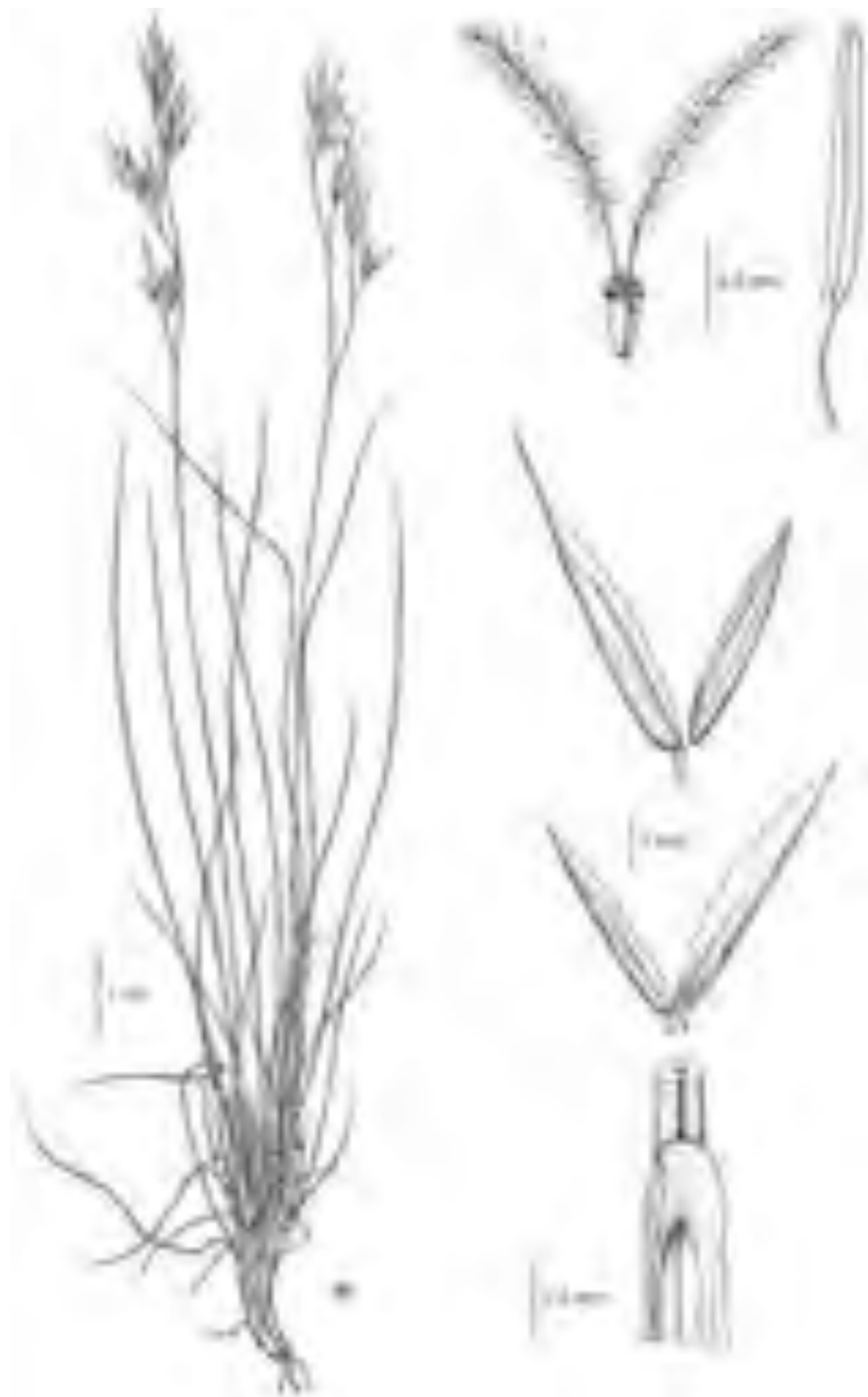
Fig. 25 Festuca sardoa (da: ARRIGONI, 1982). Festuca sardoa (from: ARRIGONI, 1982).