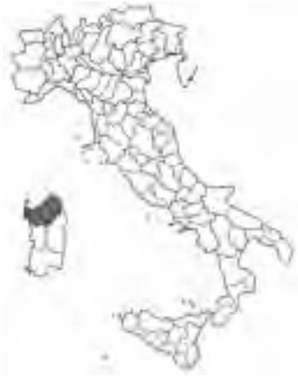
Fig. 26 Distribuzione di F. sardoa in Italia. Distribution area of F. sardoa in Italy.

Festuca scabriculumis (Hack.) K. Richt. Pl. Europ., 1: 104 (1890)