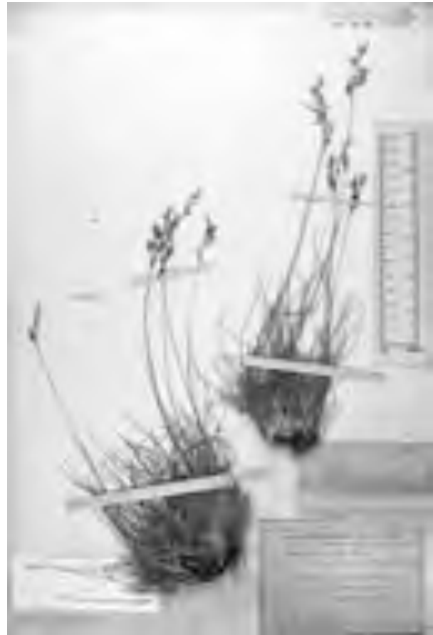
Fig. 27 Lectotypus di Festuca scabriculumis . Lectotypus of Festuca scabriculumis .

= Festuca pumila subvar. spretta (St.-Yves) Litard. Candollea, 10: 114 (1945)