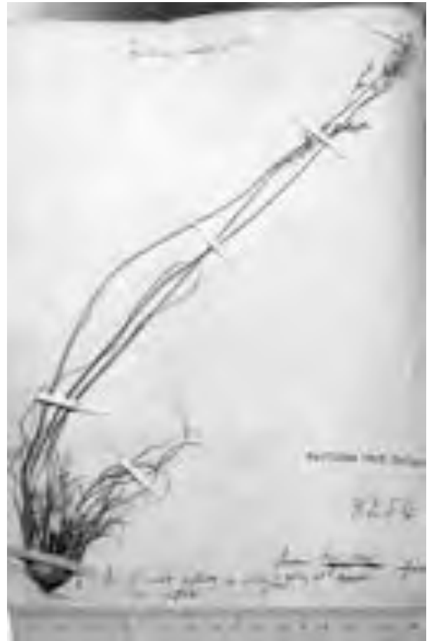
Fig. 13 Lectotypus di Festuca flavescens . Lectotypus of Festuca flavescens .

Pianta alta (25) 40-60 (70) cm, densamente cespitosa, eretta, non rizomatosa raramente pseudostolonifera. Culmo 20-50 cm, scabro sotto la pannocchia.