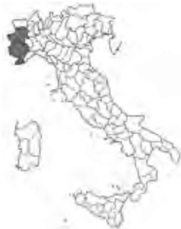
Fig. 30 Distribuzione di F. scabriculumis in Italia. Distribution area of F. scabriculumis in Italy.

& Markgr.-Dann.) J. Müller in Foggi, H.Scholz & Valdes Willdenowia, 35: 242 (2005)