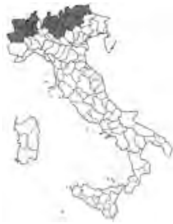
Fig. 18 Distribuzione di F. luedii in Italia. Distribution area of F. luedii in Italy.

2700 m, (BS), 8/1875, D. Belli (H-TO); Sonico, Val Malga, 2000-2381 m, (BS), 3/8/1969, C. Steimberg & C. Ricceri (H-FI); Dal Passo del Gavia verso Aprica (BS), 22/8/1995, G. Rossi (H-PAV); M. Frerone, 2200 m, (BS), 14/7/1985, E. Banfi (H-MI); Monte Tonale (BS), Agosto 1897, O. Balzarin (H-PAV).