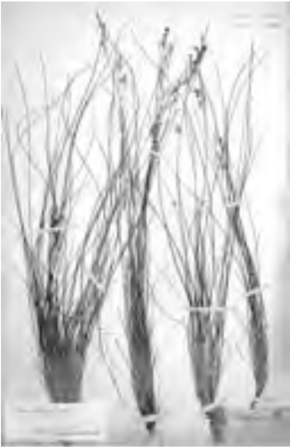
Fig. 4 Lectotypus di Festuca alpestris . Lectotypus of Festuca alpestris .