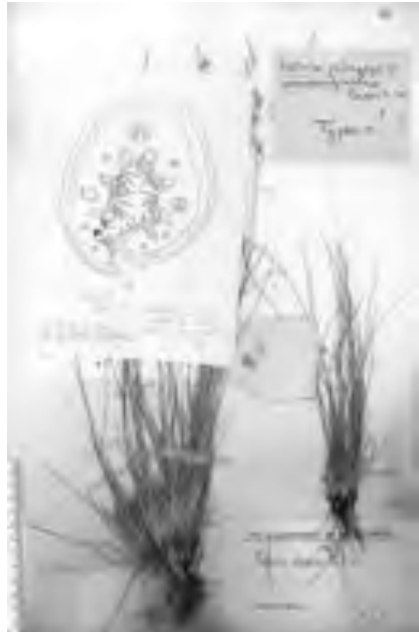
Fig. 5 Lectotypus di F. pungens var. pseudoalpestris . Lectotypus of F. pungens var. pseudoalpestris .

Hack. Bot. Centralbl., 8: 407 (1881) ≡ Festuca pumila subsp. alpestris (Roem. & Schult.) Litard. Candollea, 10: 112 (1945) ≡ Festuca flavescens subsp. alpestris (Roem. & Schult.) Nyman Conspect. Fl. Europ.: 829 (1882) = Festuca pumila var. alpestris (Roem. & Schult.) Fiori in Fiori & Paol. Fl. Anal. Ital., 4: 28 (1907) = Festuca brizoides Wulf. Fl. Nor. Phan.: 141 (1859) = Festuca pungens var. pseudoalpestris Péntes Borbasia, 3 (1-3): 15 (1941). Typus: "Monte Baldo (Italia) leg. Richter A. 1909" lectotypus qui designato in BP (Fig. 5). - Festuca alpina Host Icon. Gram. Austr., 4: 36, t. 63 (1809), non Suter Fl. Helv., 1: 55 (1802)