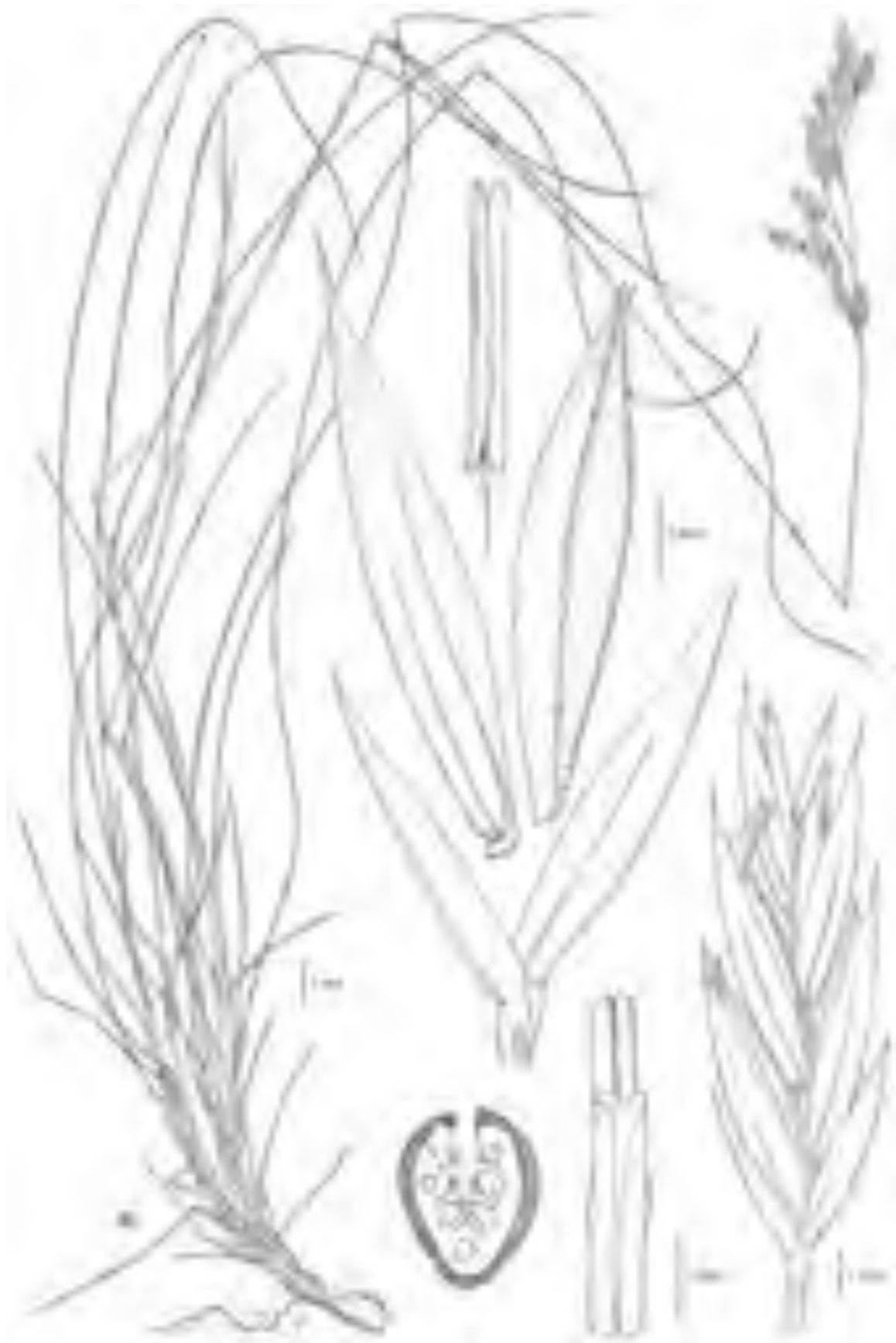
Fig. 32 Winnebach (BZ), 8/2005, G. Rossi (H-PAV) ( F. winnebachensis ).