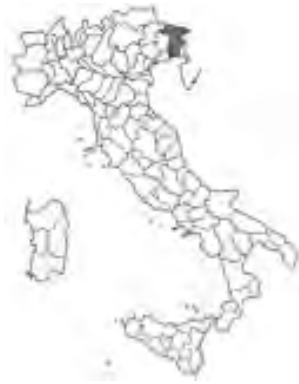
Fig. 12 Distribuzione di F. calva in Italia. Distribution area of F. calva in Italy.

Festuca flavescens Bellardi App. Fl. Pedem.: 11 (1792)