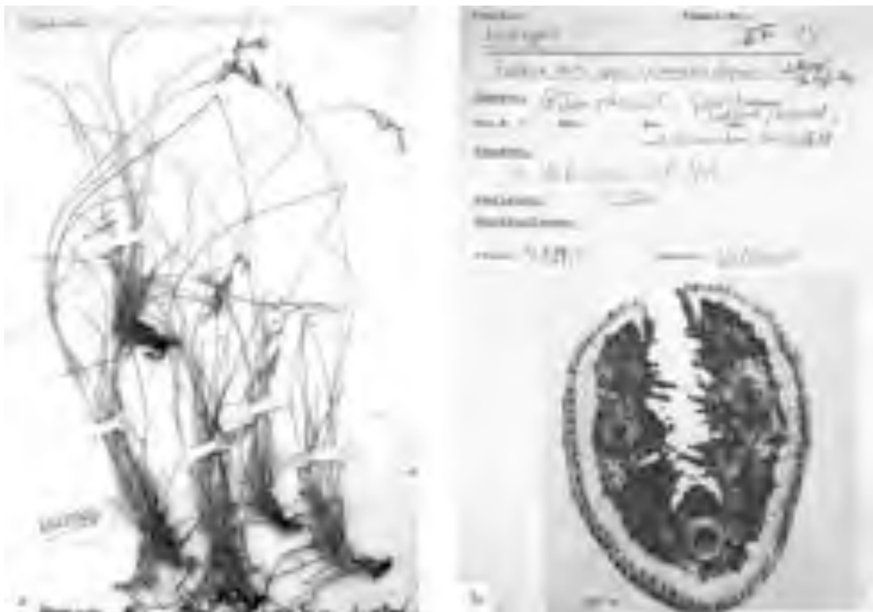
Fig. 31 Holotypus di Festuca winnebachensis , a: pianta intera, b: etichetta. Holotypus of Festuca winnebachensis , a: plant, b: label.